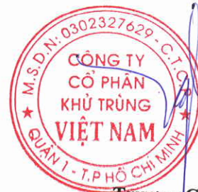
Trương Công Cứ