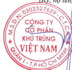
Trương Công Cứ